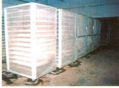
মেটালিক র্যাকে গুটি সংরক্ষণ