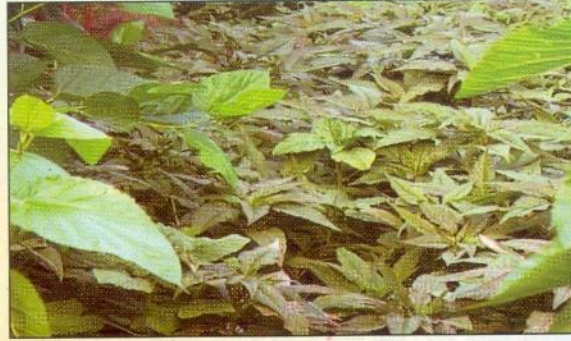
তুঁতচাষে সাথী ফসল হিসেবে ডাঁটা শাক

প্রাপ্ত ফলাফল বিশ্লেষণ করলে দেখা যায় যে, তুঁতচাষে সাথী ফসলের চাষ করলে হেক্টর প্রতি পাতার উৎপাদন বৃদ্ধি পাওয়ায় প্রতিকেজি পাতার উৎপাদন খরচ কমে আসে এবং চাষীর বাড়তি আয়ের সুযোগ সৃষ্টি হয়। বাংলাদেশ রেশম গবেষণা ও প্রশিক্ষণ ইন্সটিটিউট এ প্রযুক্তিটির ওপর দেশের ০৫টি জেলার ০৮ জন চাষীর মাধ্যমে ফিল্ড ট্রায়াল, ডেমোনস্ট্রেশন ও প্রযুক্তি হস্তান্তরের উপর কাজ করেছে। ইতোমধ্যেই তুঁতচাষে সাথী ফসলের চাষ পদ্ধতিটি মাঠ পর্যায়ে জনপ্রিয়তা সৃষ্টি করতে সক্ষম হয়েছে এবং রেশম চাষের সাথে সাথে বাড়তি আয়ের লক্ষ্যে এ তুঁতচাষ পদ্ধতি ব্যবহারের প্রতি মাঠ পর্যায়ে চাষীরা আকৃষ্ট হচ্ছে।